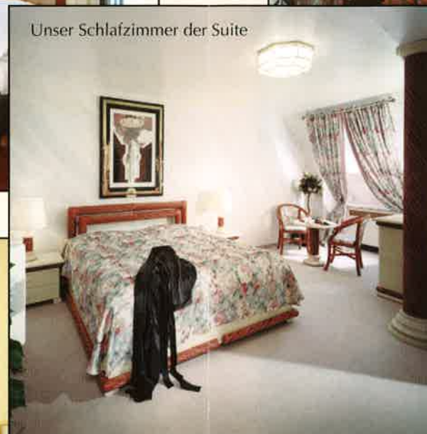
Unser Schlafzimmer der Suite