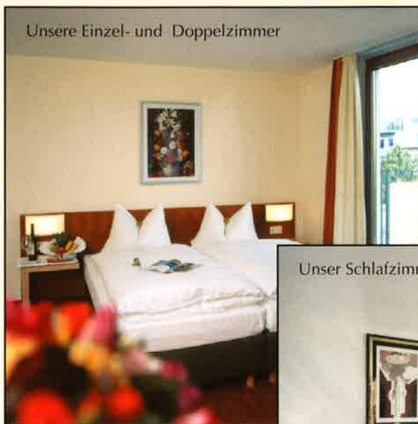
Unsere Einzel- und Doppelzimmer